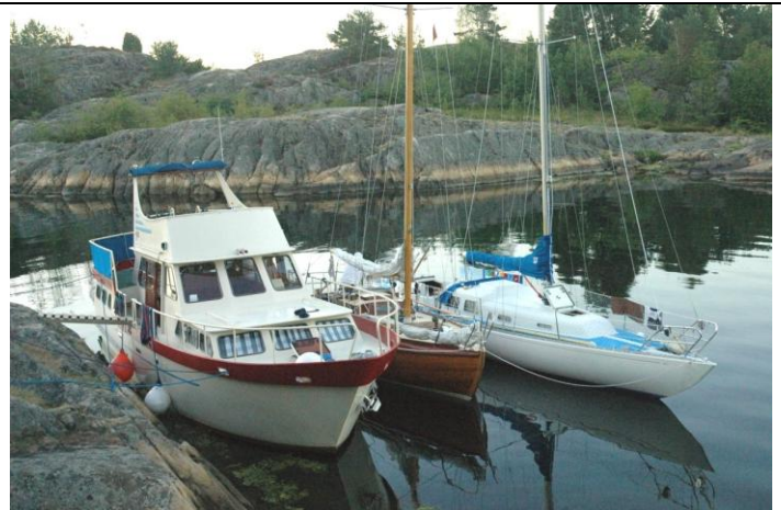
Visearmadaens båter

Der tumles med planer om ny armada neste år, med en seilingsrute som kanskje gjør det lettere å få med flere. Så vi tenker oss en kortere tur, med kortere dagsetapper, mer tid til sang og spill, og mindre værutsatt. Et sannsynlig alternativ er "Tjøme rundt". Dette er innenfor "vårt" distrikt, og vi har mange båteiene visevenner i nærheten. Her er det en flott skjærgård med mange flotte øyer man kan overnatte på, og også gode muligheter til å ankomme landeveien. Kanskje en større konsert på Verdens Ende. Men dette er foreløpig bare løse planer.