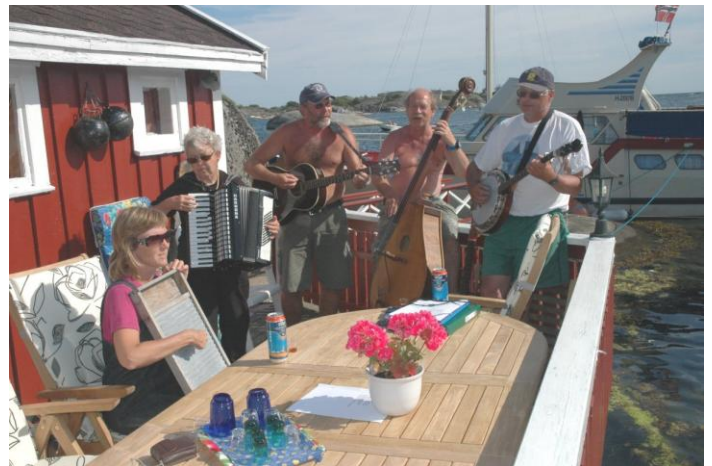
Solskinn og sang i Portør