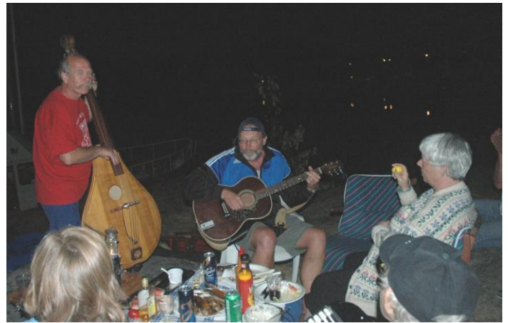
Nattjamming på skjæret