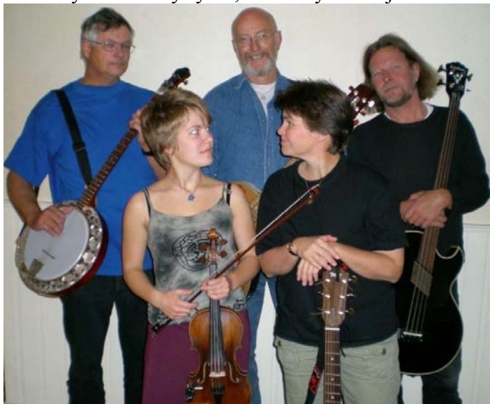
Vårt ”irske” husband: ”Lads and lasses”